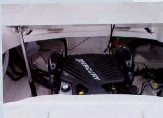
Il prendisole poppiero, con sollevamento elettroidraulico, cela il vano motore.

Strumentazione elettronica - Cuscineria prendisole prodiera - Wc marino Vacu-Flush con impianto acque nere - Caricabatterie - Verricello elettrico con ancora e catena - Frigo - Tavolini con appositi alloggi a riposo - Vhf - Scafo colorato.