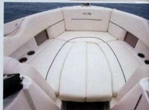
Sopra, la zona prodiera è occupata da un grande divano a U, trasformabile in un comodo prendisole di oltre 2 mq.