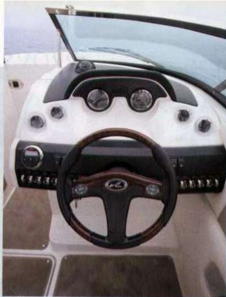
Sopra, il cruscotto mostra gli strumenti di controllo motori ben disposti per una immediata lettura.